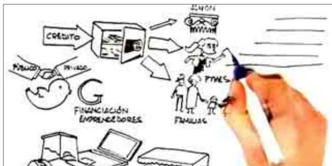
Una mano dibuja el vídeo sobre economía difundido por el PP.

candidato socialista y los usuarios podían votar por cuáles les parecían mejor. Estaba permitido marcar varias, pero sólo una vez. En el sondeo han participado casi 2.000 per-